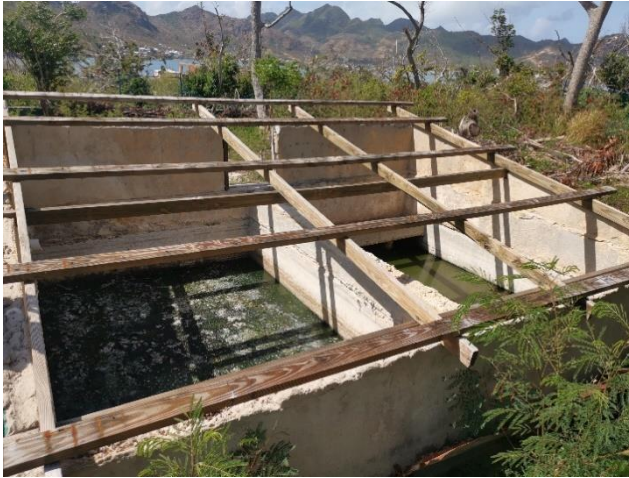
Tanque de homogenización STAR

Existe un sistema de tratamiento de agua residual conformado por un sedimentador, tanque de homogenización y biodigestor. El agua residual debe llegar a este sistema a través de una impulsión desde el bombeo descrito anteriormente. Es desconocida la capacidad de tratamiento del sistema y cuál ha sido la eficiencia de remoción de este, pues no se encuentra información disponible de los diseños o datos recolectados. Actualmente este sistema no se encuentra en operación y sus estructuras están deterioradas.