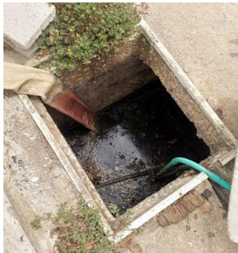
Estructura de bombeo de agua residual en Santa Catalina

La estación de bombeo de agua residual está compuesta de una caja con un volumen aproximado de 8 m 3 . Al interior de la caja se encuentra una bomba sumergible que es operada durante 40 minutos en horas de la noche cada dos días, esto en condiciones secas sin lluvia; en periodos de lluvia, es necesario realizar bombeos constantes del sistema hacia el manglar. Las aguas lluvias ingresan al sistema a través de las cajas de registro entre las acometidas y la red principal que al parecer se encuentra en mal estado.